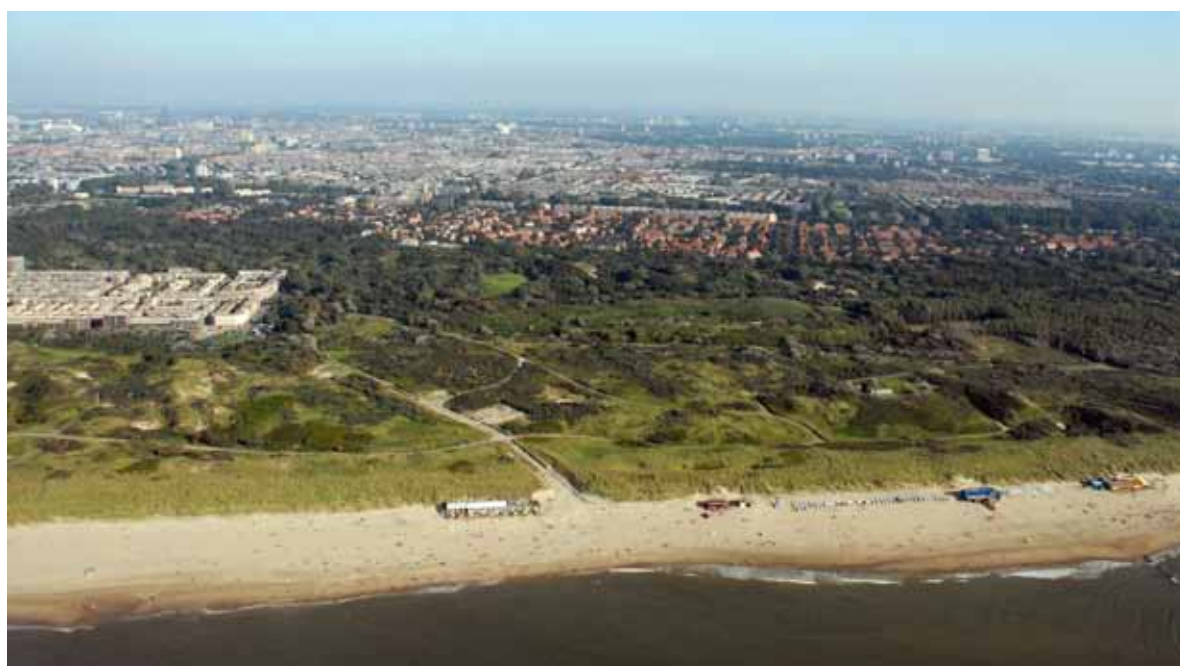
De kust bij Scheveningen (het zuiderstrand).