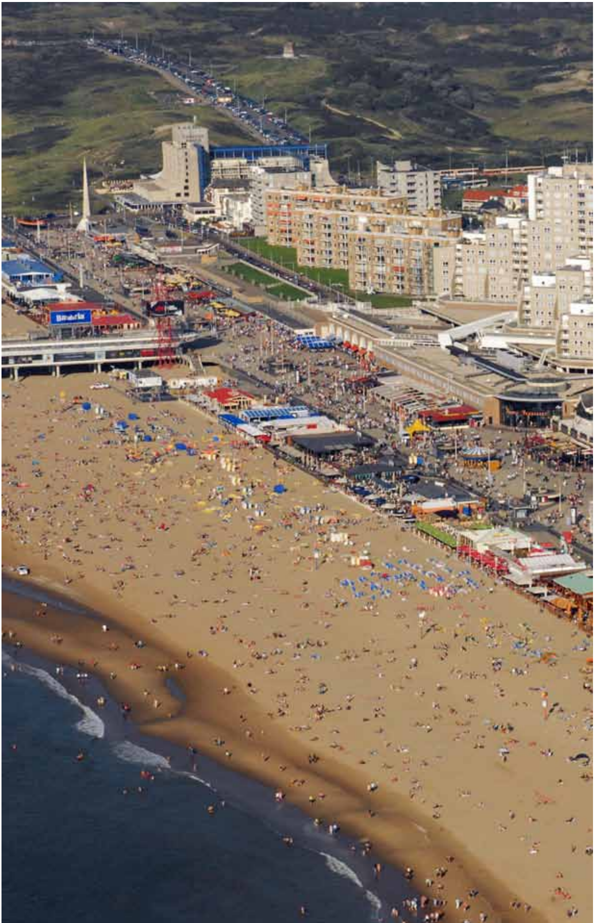
De kust bij Scheveningen.