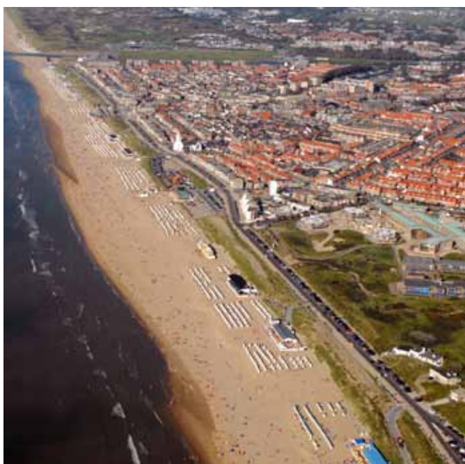
De kust bij Katwijk.

Het deelprogramma Kust van het Nationaal Deltaprogramma vraagt de provincie zich te richten op het kustfundament, het gebied van de doorgaande -20 meter dieptelijn op de Noordzee tot en met de binnenduinoet. De opgaven voor