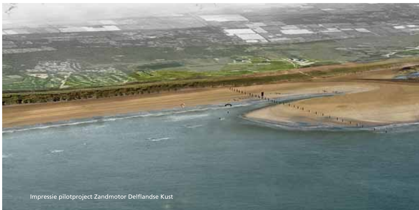
Impressie pilotproject Zandmotor Delflandse Kust

Andere delen van de Zuid-Hollandse kust kunnen op termijn ook voor grootschalige kustsuppletie in aanmerking komen, zoals de kust ten noorden van Scheveningen. Voor de kustveiligheid is dat hier voorlopig niet nodig. Bij de kust van de Maasvlakte is geen behoefte aan zeewaarts groeiende duinen. Voor de kust van de Zuid-Hollandse eilanden is een natuurlijke ontwikkeling van een slikken- en schorregebied gaande, de ontwikkeling van de Voordelta. Verstoring hiervan door grootschalige zandsuppleties is niet gewenst. De ontwikkeling van de Voordelta is geen garantie voor de veiligheid op lange termijn; voor de erosiegevoelige delen van de Zuid-Hollandse eilanden is op termijn maatwerk nodig om de veiligheid te blijven garanderen. In bovenstaande tabel zijn de opgaven voor versterken duinen en kustfundament samengevat.