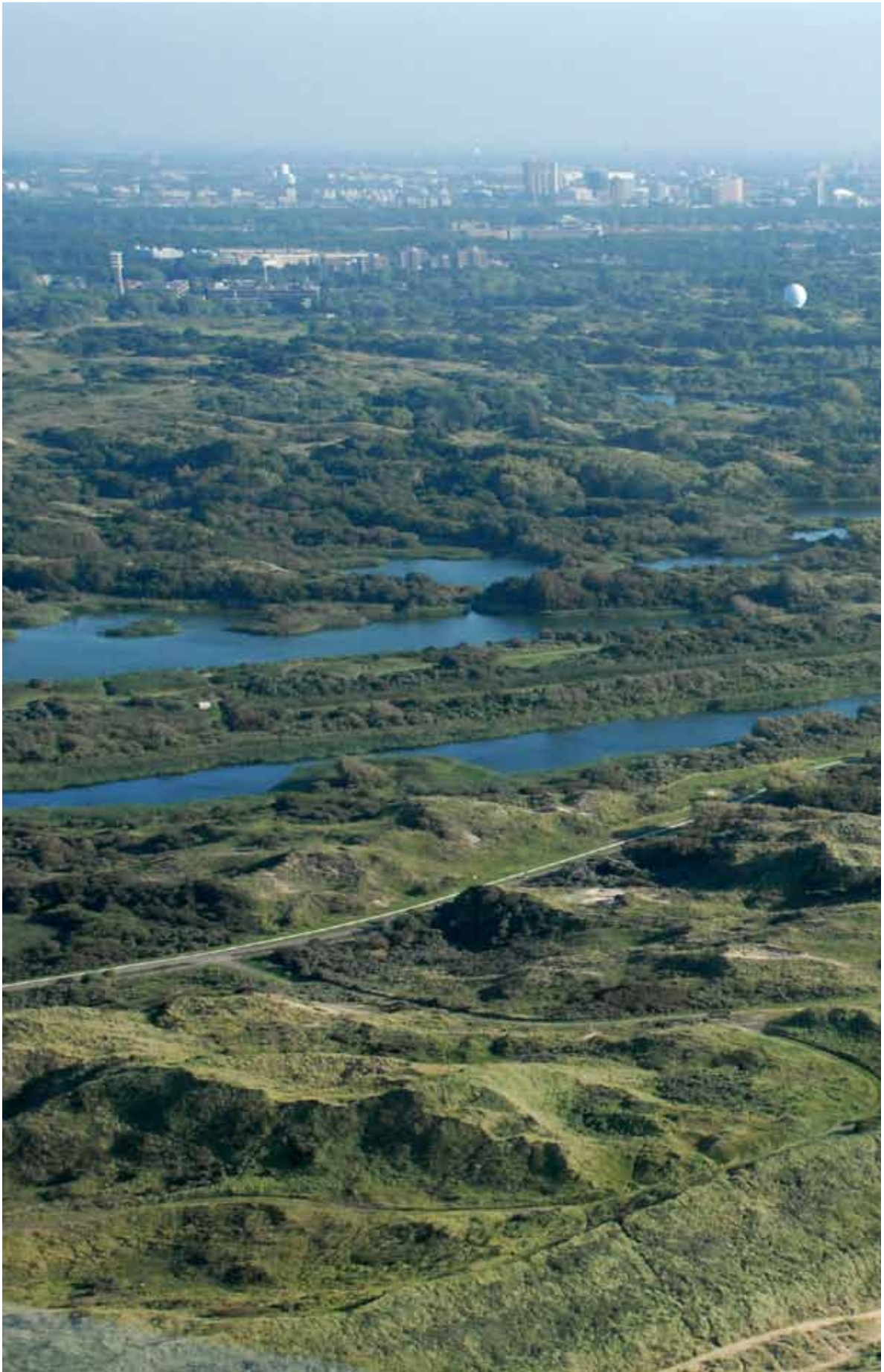
Duingebied bij Meijndel.