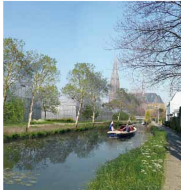
Impressie verbetering vaarwegen Westland; beeld voor en na.

om het recreatief gebruik van het Zuiderdiep op Goeree te vergroten. Voor de recreatievaart is het aantrekkelijk als er meer verbindingen zijn tussen binnenwater en de kust. Mogelijke locatie hiervoor is de monding van de Oude Rijn bij Katwijk. Uitbreiding van de recreatievaart moet geen belemering vormen voor de binnenvaart.