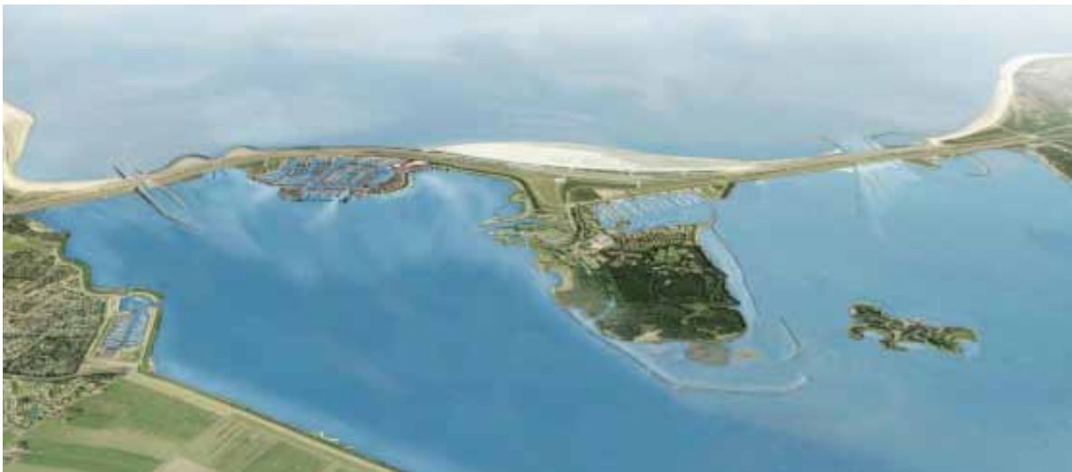
Impressie toekomstbeeld Brouwersdam.

De ontwikkeling van badplaatsen, recreatievoorzieningen en recreatief medegebruik van natuurgebieden wordt in belangrijke mate bepaald door de bereikbaarheid van de kust. Het gaat hierbij om beleid en investeringen in hoofdwegenstructuur, binnenstedelijke bereikbaarheid, parkeermogelijkheden, openbaar vervoerverbindingen, waterwegen en een goed netwerk van fiets- en wandelpaden. Vooral op warme dagen in het hoogseizoen is de druk op de wegen richting de kust groot. Het is vrijwel uitgesloten de infrastructuur en de vervoersdiensten structureel op deze uitzonderlijke momenten te ontwerpen. Mogelijke oplossingen worden gezocht in aanvullende diensten. De provincie heeft, in samenwerking met Rijkswaterstaat, het Stadsgewest Haaglanden de Stadsregio Rotterdam en de gemeente Den Haag en Rotterdam onderzocht wat de mogelijkheden hiervan zijn. (Bereik! 10)